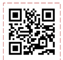
岩手医科大学リポジトリ ホームページはこちら！

メニューの一番下からは、岩手医科大学リポジトリ広報大使「めいちゃん」のお部屋へ入れます。研究に疲れた・・・そんな日は、ピュアなめいちゃんのところへ癒されにきてください！