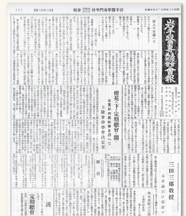
現存する最古の圭陵会々報第2巻第2号