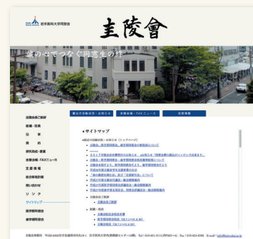
圭陵会ホームページ開設